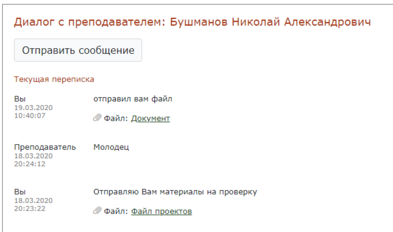
Рисунок 2 – Диалог с преподавателем.